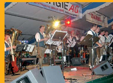
Die Niederalmner spielten am Samstag-Abend auf!