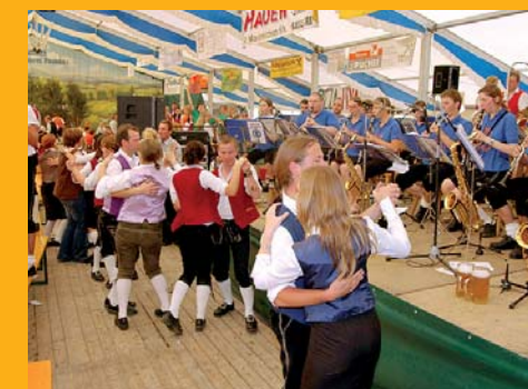
Schwungvoller Festausklang mit der WPOS-Combo