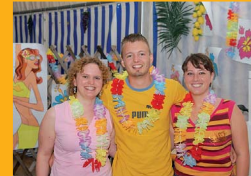
Das Team von der Cocktail-Bar