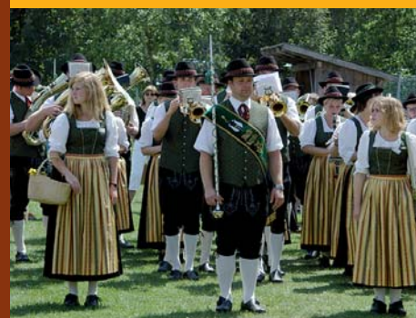
Aufstellung zum Festakt am Sonntag