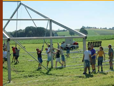
Der Zeltaufbau beginnt...