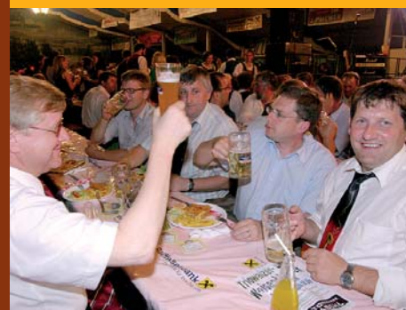
Gute Stimmung im Festzelt