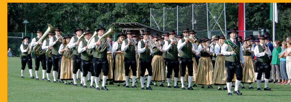
Marschwertung am Sonntag früh bei Bilderbuchwetter!