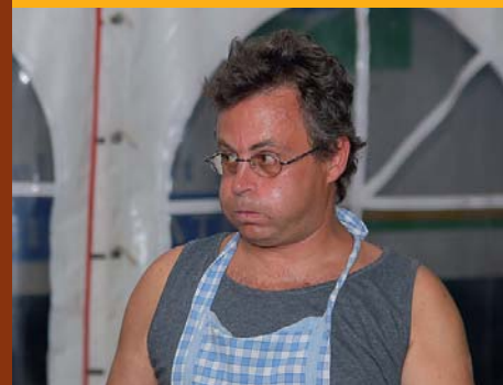
In der Küche war es heiß und anstrengend