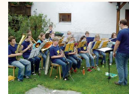
Jugendkonzert beim Müllner z'Gstötten