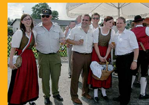
Auch die Ehrengäste amüsierten sich bestens!

Bildergalerie der Jubiläumsveranstaltungen