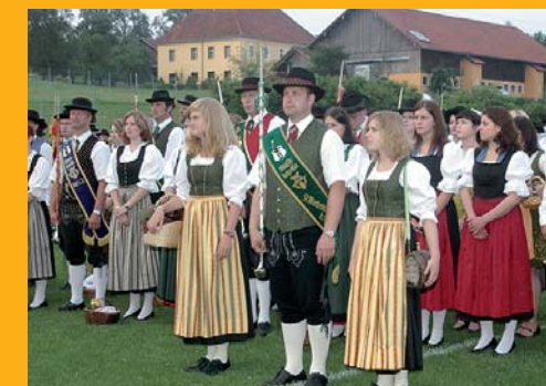
Stabführer und Marketenderinnen beim Festakt