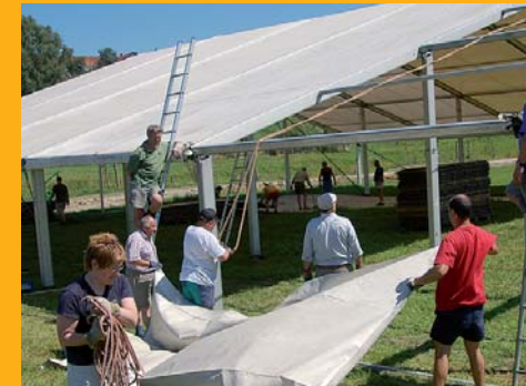
...und geht zügig voran!