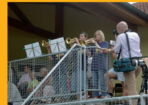
Eröffnungsfanfare der Jugendmarschwertung