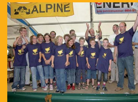
Platz 3 - Jubel bei der Siegerehrung!