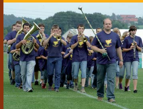
Unsere Jugendkapelle bei der Wertung